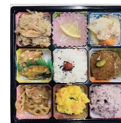
「道の駅弁」 ※写真は昨年のももの