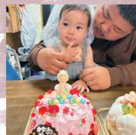
これからもすくすく大きくなあれ♡！