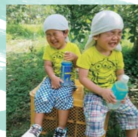
もうすぐ夏がくる!!