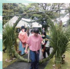
半年のけがれをはらう神事、戸馳神社の茅の輪くぐり