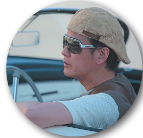
当日は唐沢寿明さんも各会場を巡ります

世界文化遺産登録 10周年を記念して 三角西港もスタン ポイントとして 通過します!!