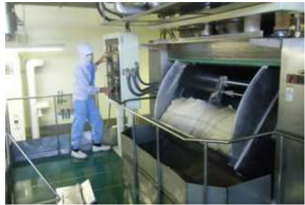
九州フジパングループ本社 株式会社

商品開発会議に若手社員に参加してもらい、若者の意見を出してもらっています。また、女性目線での商品開発に協力してもらっています。