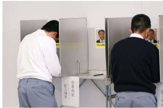
投票用紙に候補者の名前を記入