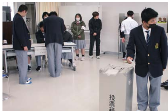
実際に受付から投票箱に入れるまでを体験