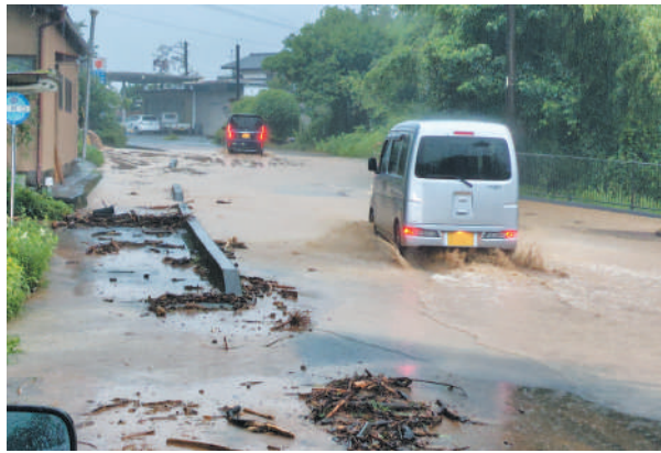
寺村口バス停付近（豊野）の浸水被害

た雨がそのまま道路上に流出するためであり、まずは雨が流出しない対策をとることが原則とのこと。市としては、現地の排水施設の状態を調査し、改善策を検討する。また、土地所有者と流出水の対策を協議するとともに、今後の改善対策を研究する。