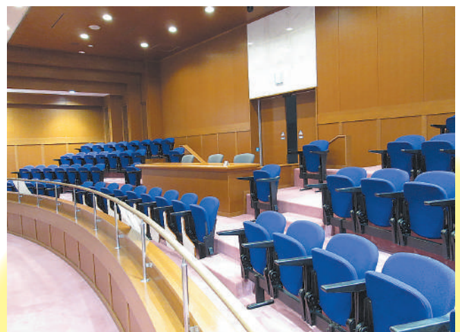
傍 聴 席