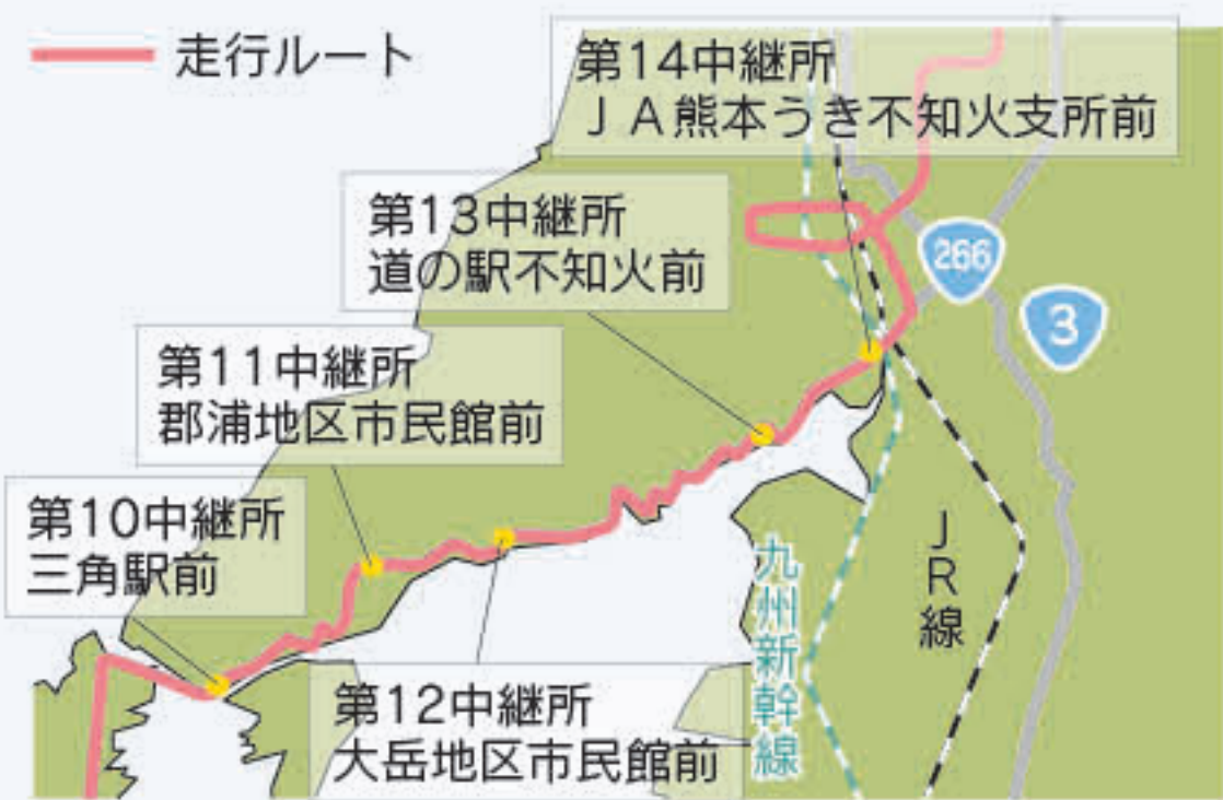
図 文化スポーツ課 ☎32-1945