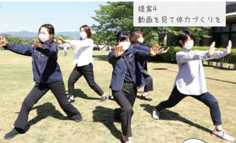
提案4 動画を見て体力づくりを

新型コロナウイルスに感染しないために、そして健康的な生活を送るために、日常生活で人との接触を控えた新しい生活様式を定着させていきましょう。