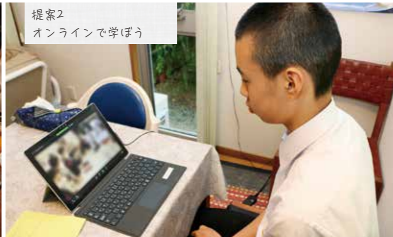
提案2 オンラインで学ぼう