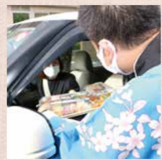
「今日のおかずはこちら」

売上減の飲食店を支援 ドライブスルーで 弁当やおつまみを販売します 市役所で5月18日から、市内の飲食店など約10店舗が参加するドライブスルー形式の惣菜販売が始まりました。 飲食店の経営支援と家庭でもお店の味を楽しんでもらおうと市商工会や地域おこし協力隊、市商工観光課が企画。スタッフが車中に待機する来場者の注文を受け、販売しています。 皆さんも飲食店の応援に参加しませんか。 時間 11時30分〜13時(月〜水) 16時30分〜18時(月〜金) 場所 市役所南側駐車場 市商工観光課 ☎ (32) 16004