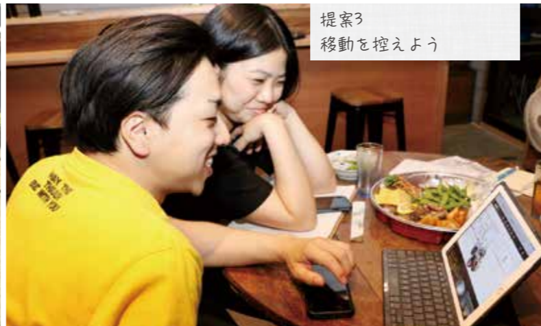
提案3 移動を控えよう