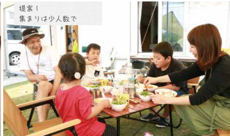
提案1 集まりは少人数で