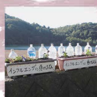
海に浮かぶくまモン さん 三角町