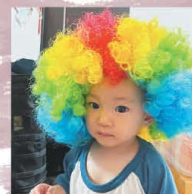
2人のお姉ちゃん さん 松橋町