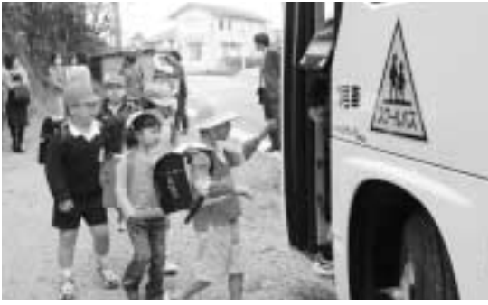
初お目見えした真っ白なスクールバスに乗り込む児童ら

なお8日の三角小学校登校日に先立ち、6日、戸馳地区の小学生がスクールバス乗車練習を行いました。2台のバスは午前7時30分に田井浦地区と片島地区のバス停を出発。保護者らと児童は、各地区区力所に設けられたスクールバス乗り場で乗車しました。戸馳島を巡回して児童を乗せたバスは、午前7時55分に宇城市役所三角支所前に到着。児童は注意事項を聞いた後、高台の小学校へ徒歩で登校しました。急な登り坂に息を弾ませながら歩くこと10分。児童からは「戸馳の時より歩く