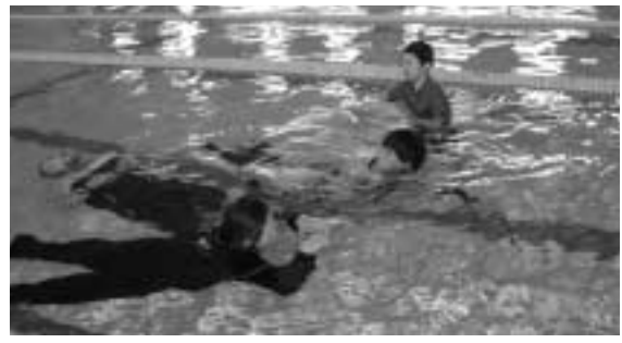
着衣泳を体験する参加者たち

また、水難事故の怖さを模擬体験してもらつた「着衣泳」の体験会もあり水を吸った衣類の重さを実感していました。なお、この日は終日無料開放され水泳愛好者にぎわいました。