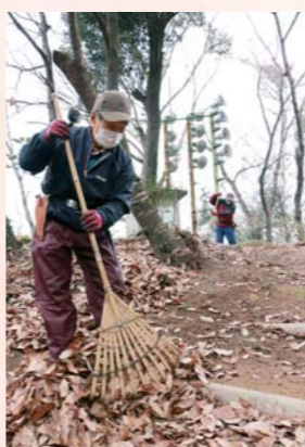
滑らないように清掃

1年かけて整備した自然豊かな遊歩道です。ゆっくり歩いて1時間程度。お子さんとハイキングなどいかがでしょうか。