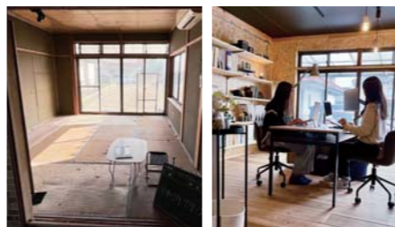
(左)改修前 (右)改修後、活動拠点に

空き家対策を進めている宇城市で「空き家を活用してシェアオフィスにしよう」とDIYを企画。協力隊員3人で全ての作業をしています。別々の目的を持つ協力隊が集まってアイデアを出し合いながら、地域の人との交流拠点となることを目指しています。放置されてしまう家を活用や起業時の拠点として活用できる新しい取り組みです。