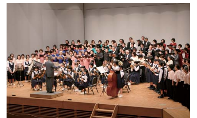
美しい歌声が響き渡りました

出演者たちは、日頃の練習で培った伸びやかな歌声を披露。観客はメロディーを口ずさみながら共に歌の世界を楽しみました。この日は松橋中吹奏楽部や宇土市立鶴城中合唱部がゲスト出演し、節目の祭典を盛り上げました。フィナーレには観客と共に市歌「伸びゆく宇城市」などを大合唱しました。