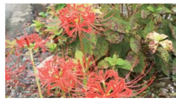
ヒガンバナ