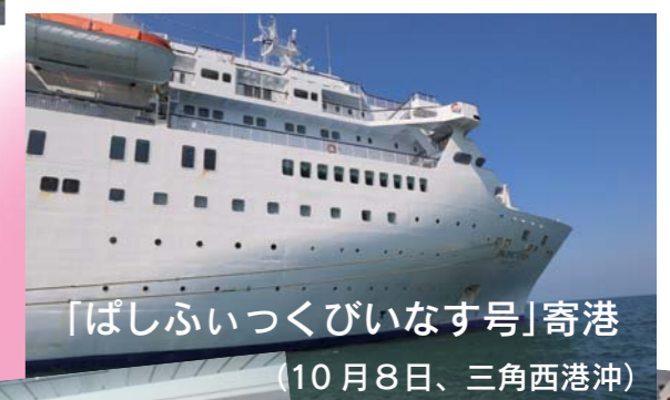
「ぱしふいっくびいなす号」寄港 (10月8日、三角西港沖)