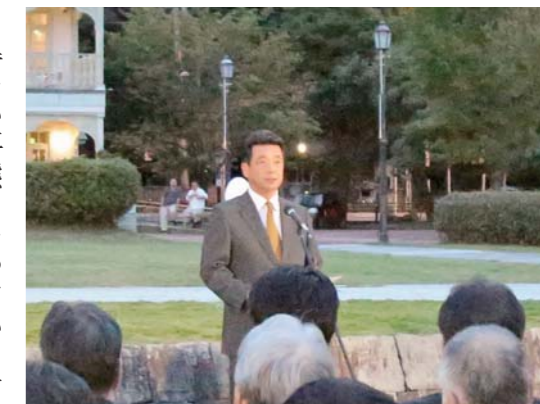
三角西港130周年記念式典にて