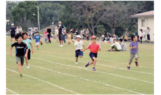
走ることの楽しさを学んだ子どもたち

松橋町の県博物館ネットワークセンター多目的広場で陸上教室が開かれ、市内に住む小学生約100人が、短距離走ややり投げの一種「ジャベリックスロー」などの陸上競技を楽しみました。運動の基本である「走る」技能の向上と共に、他校の児童との交流を図り、スポーツ選手としてのマナーを身に付けることなどを目的に毎年開かれているこの教室。児童たちは熊本大学陸上競技部の学生の指導を受けながら、トラック競技やフィールド競技の楽しさに触れることができました。