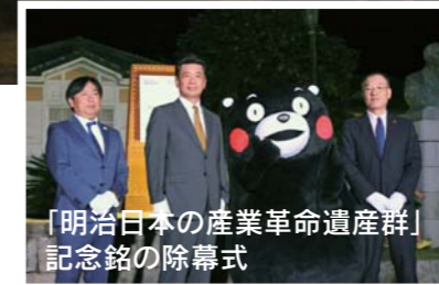
「明治日本の産業革命遺産群」記念銘の除幕式