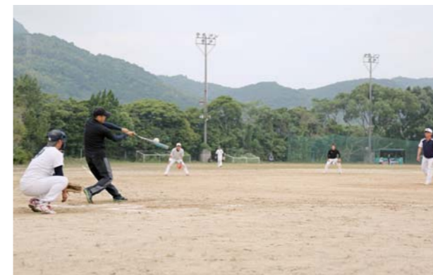
交流が深まった参加者たち

ソフトボールを通じて、お互いの地域で世代を超えた交流を深め、地域のにぎわいにつながればと開かれたこの大会は、今回で2回目。日頃、練習を重ねている人も初心者も、終始和気あいあいとした雰囲気の中で試合が繰り広げられ、選手も応援の人たちも笑顔あふれる大会になりました。参加者の一人は「競技はもちろん、日頃会えない人と近況を語り合うことができて楽しかった」と話しました。