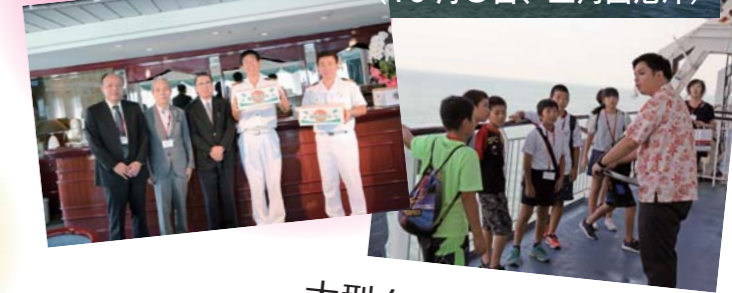
大型クルーズ船が 三角にやってきた♪