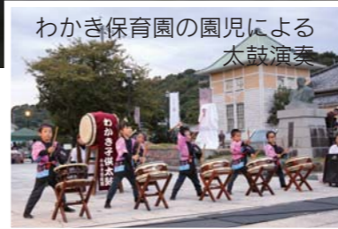
わかき保育園の園児による太鼓演奏