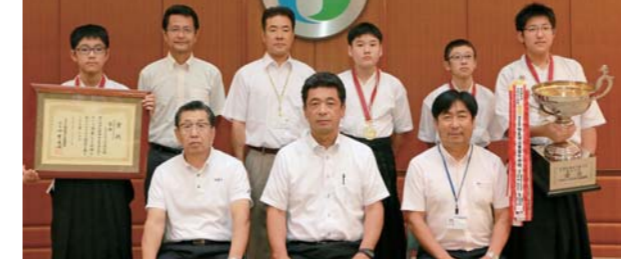
全国制覇を遂げた小川中男子弓道部の皆さん