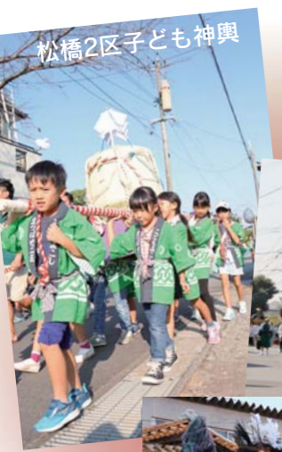
松橋2区子ども神輿