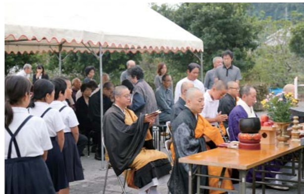
犠牲者の冥福を祈る参列者

中内区長は「災害を経験した者として、この気持ちを風化させることなく防災活動などにも生かしていきたい」とあいさつ。慰霊祭の後には高潮を想定した避難訓練も行われ、参加者たちは高台にある松合小までの避難経路などを確認しました。