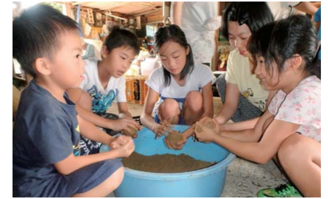
楽しく取り組むことができました

EM団子を作った小学生は「川がきれいになるとうれしい」とにっこり。かかしの顔を描いた小学生は「お母さんの笑っている顔をモデルに、満足のいく作品になった」と笑顔で話していました。