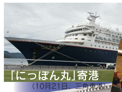
「にっぽん丸」寄港 (10月21日、三角東港)