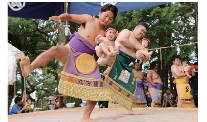
すくすく元気に育つてね

今回は66人の元気な赤ちゃんが土俵入りし、健康を祈願。力士と共に土俵入りした赤ちゃんが大泣きしてしまう場面に、観客からは温かな声援が送られていました。また、この日は、幼児、小学生、大人に分かれ、相撲相撲大会が開かれたほか、同神社の伝統芸能「曲野神楽」の奉納演舞も披露され、集落の子どもたちによる舞に大きな歓声が上がりました。