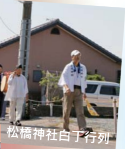
松橋神社白子行列