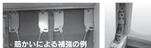
金物による補強の例