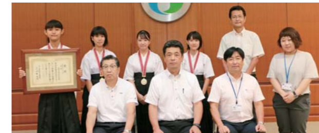
全国大会3位の小川中女子弓道部の皆さん