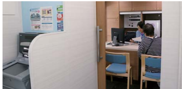
車内にはATMと銀行窓口などを搭載