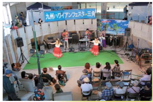
九州ハワイアンフェスティバル (10月8日、三角東港)