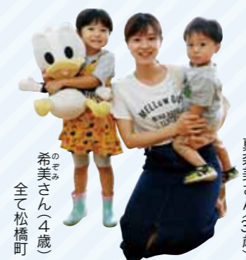
希美さん(4歳) 全て松橋町