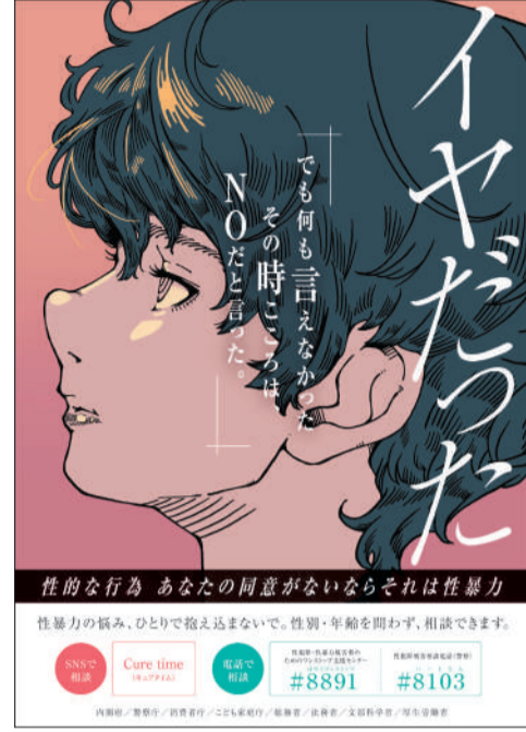
「内閣府男女共同参画局作成ポスター」引用

電話で相談 あなたは何もわるくありません。相談できる場所があります。 性犯罪・性暴力 被害者のためのワンストップ支援センター #8891 性犯罪被害 相談電話(警察) #8103