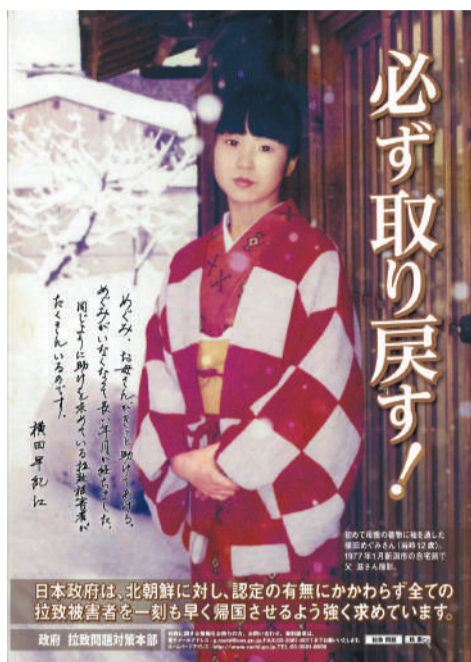
「内閣官房拉致問題対策本部事務局作成ポスター」引用