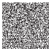
宇城クリーンセンター