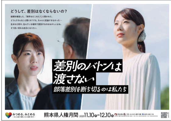
「熊本県人権同和政策課作成 令和7年度熊本県人権月間ポスター」引用