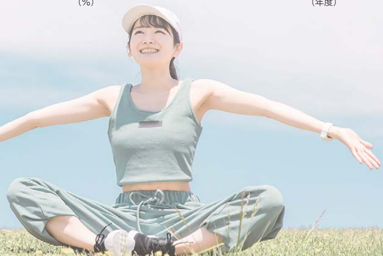
図 医療保険課 ☎32-1417 健康づくり推進課 ☎32-7100