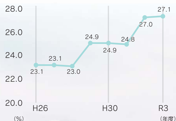
BMI25以上の肥満者の割合(宇城市国保)