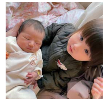
おどおどさん 松橋町 お姉ちゃんになりました