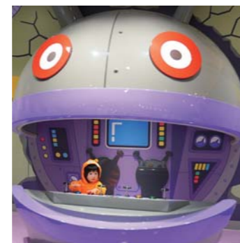
夕風さん 松橋町 アンパンマンだいすき女の子 念願のアンパンマンミュージアムデビューしました♡