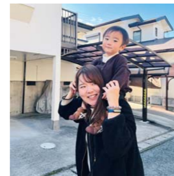
ぼちたさん 松橋町 ママに肩車されています！