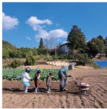
ままびよさん 松橋町 ひいじいちゃんと一緒に畑仕事！ひいじいちゃんには、ひ孫が12人いるよ！いつまでも元気でね！