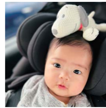
IROKA 大好きマンさん 三角町 わたちの大好きなスヌーピーだよ！ おでかけも一緒なの！