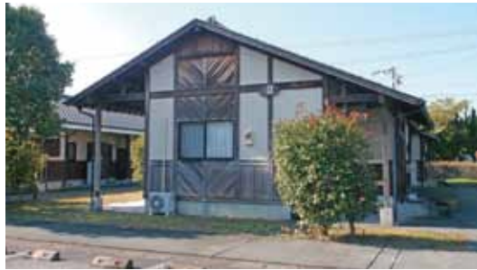
響原復興住宅(豊野町)