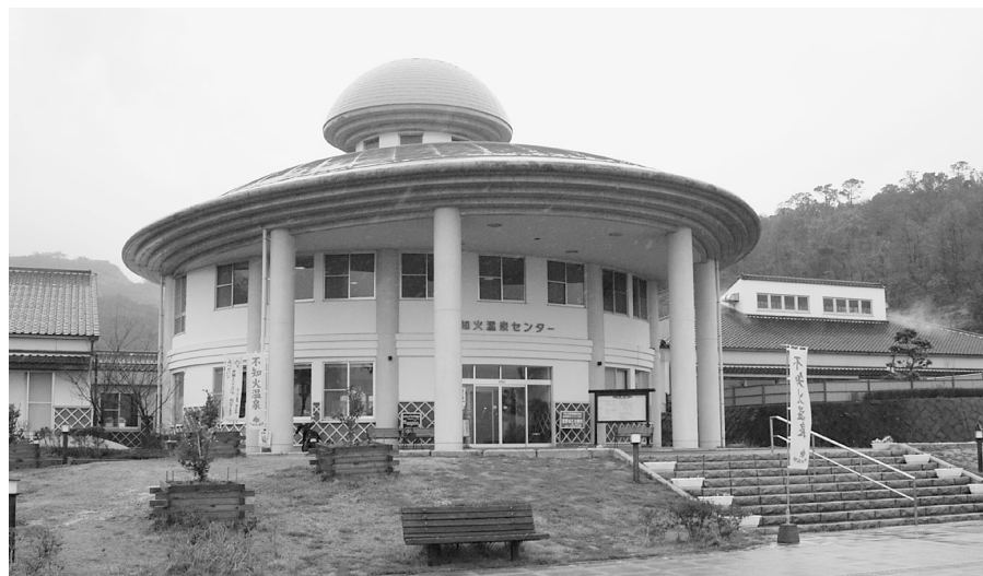
不知火温泉ロマンの湯

不知火温泉「ロマンの湯」では、日ごろの疲れを癒やします。 温泉成分は、塩素イオン、ナトリウムイオン、カルシウムイオンなどが含まれており、神経痛・切り傷・やけど・慢性皮膚病などに効果があります。 また、併設の物産館では、地域特産品を1,000種類以上取りそろえています。 地元の漁港で水揚げされた魚や、産物など地域の特色を出した商品が数多く販売されています。 また、道の駅は旅行の途中、疲れを癒やす休憩所として利用されています。