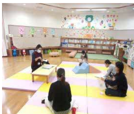
育児講座「入所について」