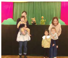
人形劇、楽しかったかな？