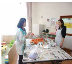
「干し柿作り」も挑戦し