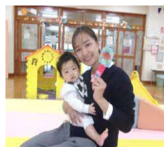
おうちで沢山遊んでね★