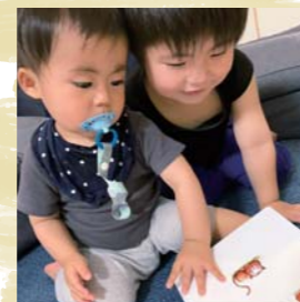
お兄ちゃん一緒に絵本 よもう〜いいよ〜^_^