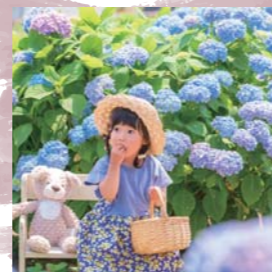
紫陽花がきれいでした♡