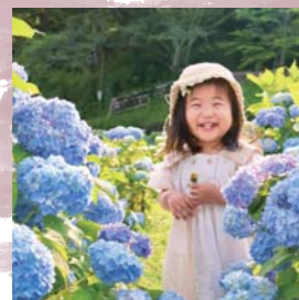
お花いっぱい〜い♡ きれいねえ〜♡