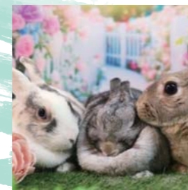
グリちゃん誕生日おめで とう！