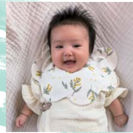
最近よく笑います！