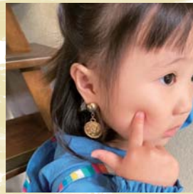
お洒落をしたいお年頃