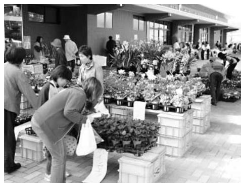
松橋町の特産品が勢ぞろい!!

● 松橋町特産品フェア ● 松橋保健福祉センター駐車場 ● 内容 新鮮野菜・花・伝統工芸品・加工品など松橋町の特産品が大集合 ● 今回の目玉企画 ● 11日 野菜の無料配布 ● 12日 花苗の無料配布 (先着100人) ● 包丁とき (有料) ● 花の寄せ植えコーナー ● 問合せ先 松橋市民センター 産業課 ☎32-11111