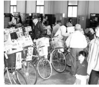
あなたも当たるかも

● 春の入学シーズンに合わせ来場者だけに当たる抽選会を行います。 ● 期日 3月31日(金) ● 時間 午後1時30分受付開始 午後2時抽選 ● 場所 宇城クリーンセンター・リサイクルプラザ ● 台数 20台 ● 問合せ先 宇城クリーンセンター・リサイクルプラザ ☎32-6005