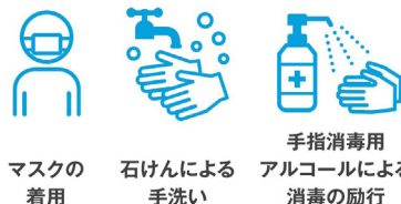
マスクの着用 石けんによる手洗い 手指消毒用アルコールによる消毒の励行