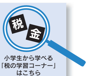
図 宇土税務署 ☎22-0410

今年のテーマは「くらしを支える税」。皆さんの生活に関わるものの多くに、税金が使われているのを知っていますか。この機会に、皆さんが納めた税金がどのように使われているかを学んでみませんか。