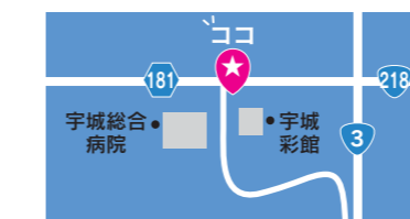
図 上下水道課 ☎32-1674