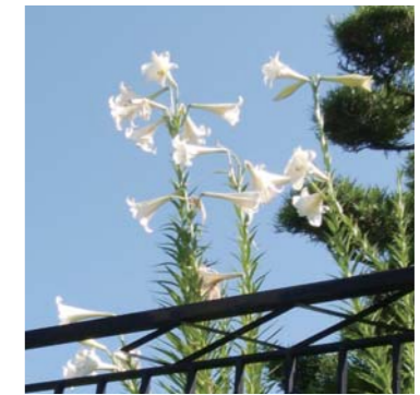
ワイルドストロベリーさん これぞ高嶺のユリ！◎ 小川町