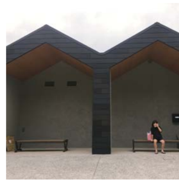
カフェモカさん 松橋町 先日金桁温泉に行ってきた 娘がたくさん写真を撮って ました(^^) また利用します！