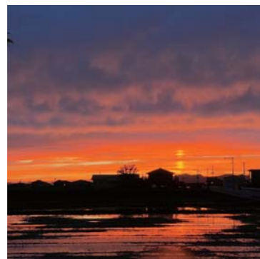
ピースさん 小川町 夕日がとても綺麗でした♡