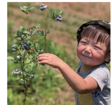
ゆあつちさん 不知火町 大好きなブルーベリー♡ やつと実ったよ！