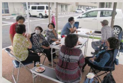
仮設住宅で昨年開かれたサロン