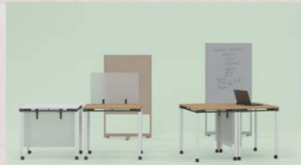
業務内容や使う人数に合わせてレイアウトができるテーブルや空間を効率的に使う間仕切り兼ホワイトボード

新型コロナウイルスの感染拡大や多発する自然災害…。住民生活に直結する役所は、いかなる状況下でも行政機能を継続し、適切なサービスが提供できるよう日頃から備えておかなければなりません。そこで市は、包括連携協定を結ぶコクヨ株式会社とフェーズフリーな空間づくりをスタート。7月中旬からテスト導入を行います。