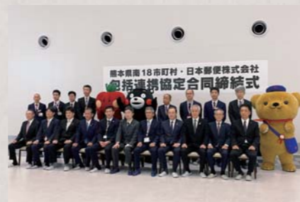
八代市で行われた締結式

5月12日、県南18市町村が合同で日本郵便株式会社と包括連携協定を結びました。協定内容は郵便局のネットワークを生かした地域の見守り活動や地域経済活性化、市民サービスの利便性向上など。地域の郵便局と連携し、高齢者の見守り活動や特産品販売・PR活動を行います。