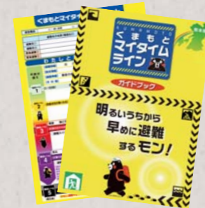
ダウンロードはこちら