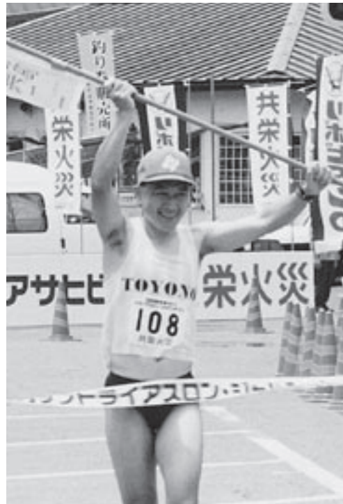
野尻湖トライアスロン大会(長野県)で完走

現在、宇城市役所には636人の職員が市民の生活向上のため、業務に励んでおります。その中で、業務以外でもボランティア活動などで、市民の皆さんと交流を深め、より一層地域に溶け込もうと努力している職員をご紹介します。