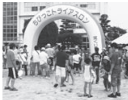
ちびっこトライアスロン大会

今年の夏も第11回大会を開催することができました。おかげさまで県内各地はもとより九州