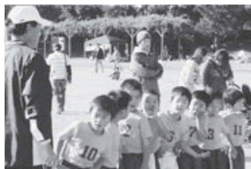
とよのジュニアサッカー

各県から参加していただきました。私は体育指導委員を離れて6年になりますが、今年も陰から支えて運営に携わっています。そのほか、毎週日曜日に小学1年から3年生を対象にジュニアサッカーを3人の有志で行っています。始めたころは、近くのクラブと試合をしても勝つことが少なく、指導することの難しさを痛感していました。