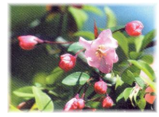
カイドウ 竹崎季長ゆかりの花

※各種研修・各種会合・レクリエーション・バーベキューなど、様々な用途にご利用ください。