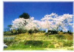
平原公園(竹崎季長墓:市文化財)