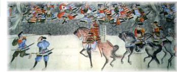
蒙古襲来絵詞(市文化財)