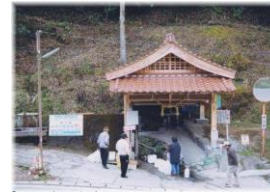
峠の岩清水(肥後の水資源愛護賞)