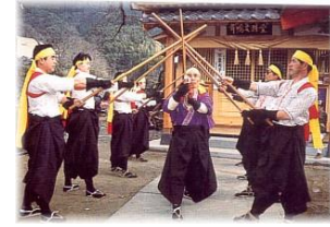
舞鳴棒踊り(市文化財)