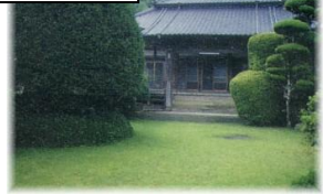
塔福寺(竹崎季長菩提寺)