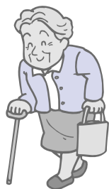
被害者Aさんの話 (1人暮らし)

最近、1人暮らしの高齢者を狙った悪質な消費者被害が県北地域で起こりましたその事例をご紹介します。