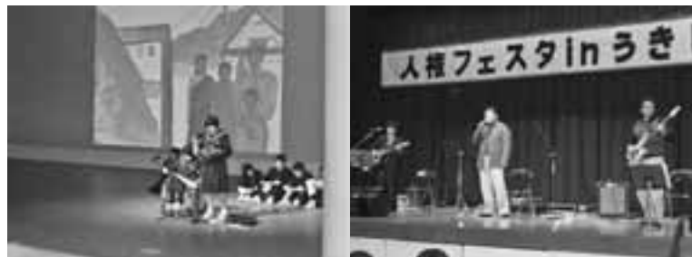
松橋会場の様子 (12月10日)