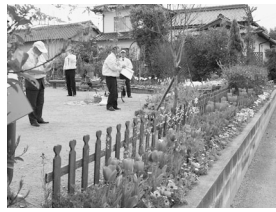
お宅の花壇もコンクールにエントリーしてみませんか?

宇城市では、第1回花のまちづくり花壇コンクールを実施します。 対象花壇 『庭先から道路まで』を対象に、宇城市内でみんなの目に触れる花壇を原則とします 応募方法 本庁商工観光課および各支所産業課に備え付けの応募用紙に必要事項を記入のうえ、3月18日(金)までに提出してください