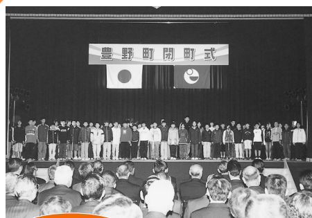
旧豊野町 豊野中学校 (1月8日)

合併が決定し、新市「宇城市」の協議事項など新市発足の準備が進む中、並行して閉町式典も各旧5町で行われました。そして、1月14日それぞれの旧町役場で、閉庁式が行われ長い歴史を持つ町の歴史に幕が降ろされました。