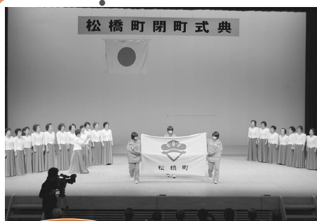
旧松橋町 ウイングまつばせ (1月4日)

閉町式典では、合併50周年記念も行われました。閉町式典の町旗降納は、平成17年4月に統合する三角小学校と、戸馳小学校の6年児童が行いました。