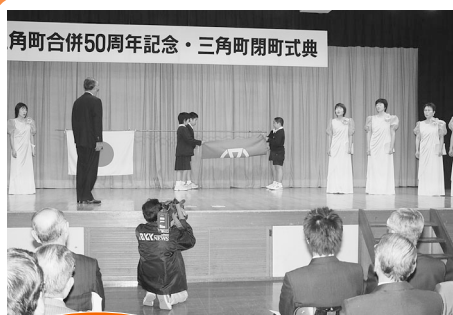
旧三角町 三角センター (1月12日)

閉町式典では、合併50周年記念も行われました。閉町式典の町旗降納は、平成17年4月に統合する三角小学校と、戸馳小学校の6年児童が行いました。