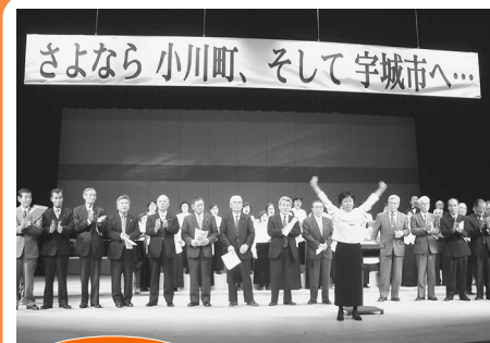
旧小川町 ラポート (12月26日)

松橋中学校陸上部(昨年12月開かれた全国中学校駅伝廿子の優勝メンバー)による、町旗降納。3人の町員代表による、町への想いの朗読もありました。