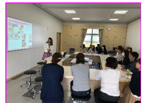
過去のマミーゴー講座の様様