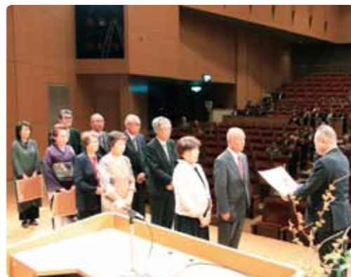
昨年の金婚夫婦表彰

※熊本日日新聞社の「金婚夫婦表彰」に合わせて、記念写真を贈呈。表彰式は9月26日④に、ウイングまつばせで開催します。