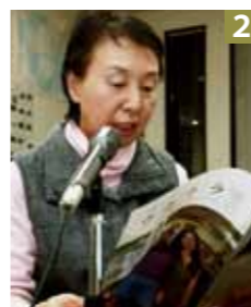
1 市長を表敬訪問 2 声を吹き込む