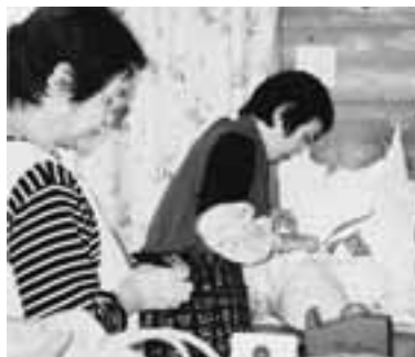
客と並んで品物を袋に入れる店員

JA熊本うき小川町支所の一角に、小川町農産物販売所「すずめのおやど」があります。時々、買い物に行くのですが、ちよつと面白いことに気付きました。それは「レジの当番制」です。レジ台の所が狭いからだと思うのですが、レジスターを通った品物を対面ではなく買い物客と並ぶ形で、店員が袋に入れるのです。最初は少し戸惑い、それが今回の取材のきっかけになりました。