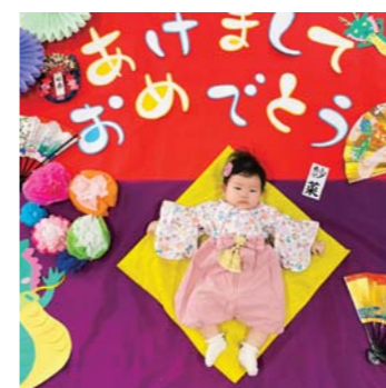
サナちゃんさん 松橋町 楽しい1年に なりますように