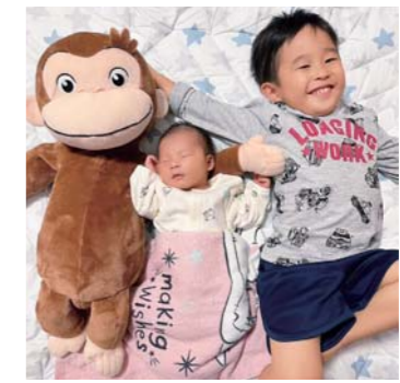
おさるのジヨージさん 松橋町 いとこ同士でパシヤリ