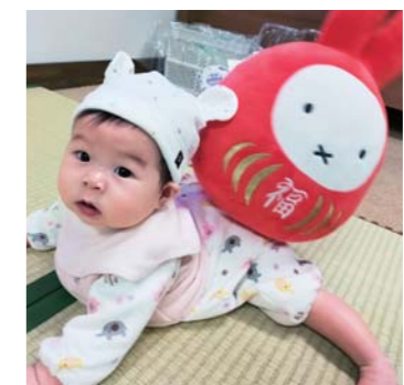
ゆあちゃんさん 松橋町 はじめてのお正月