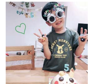
そうちちゃんばあさん 松橋町 お誕生日おめでとう