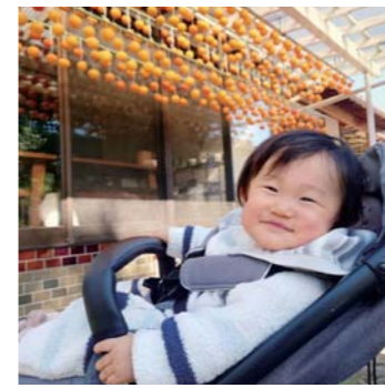
しおん君さん 三角町 干柿だあ〜いすき♡ お父さんいつもありがと♡