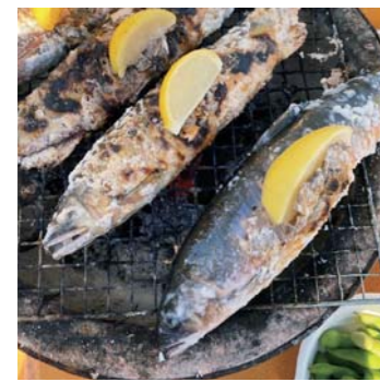
ちやぼファミリーさん 松橋町 宇城市スポーツ推進モルック 大会出場後にみんなまでワイウ イBBQ♪天然あゆ最高〜！