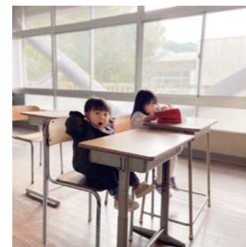
学校の先生だった人さん 松橋町 学校楽しい人々？